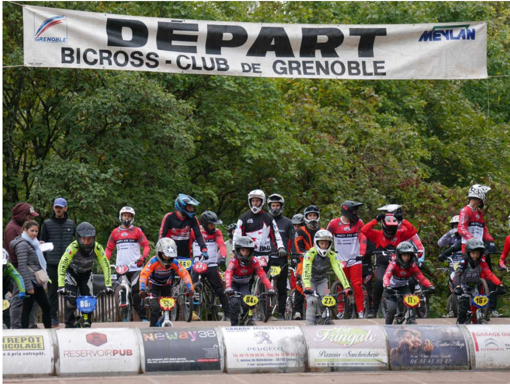
Coupe des Lacs édition 2022