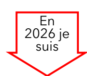
Tableau montees-descentes 2026-2027 Homme